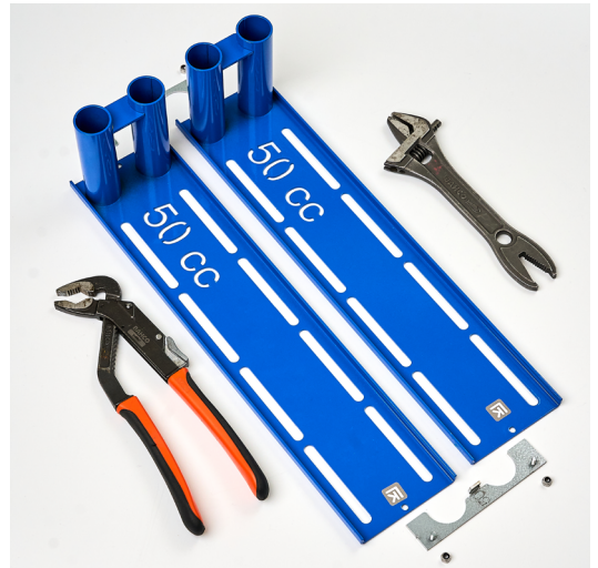
Metalliläppä on ylöspäin. Työkalut eivät sisälly.