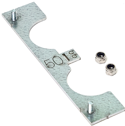
Yksi LK Patterikiinnike Välilevy kahdella mutterilla.